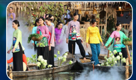
Ảnh Những chiếc áo bà ba thướt tha trên hồ sen Photos of Graceful Áo Bà Ba Amidst the Lotus Pond