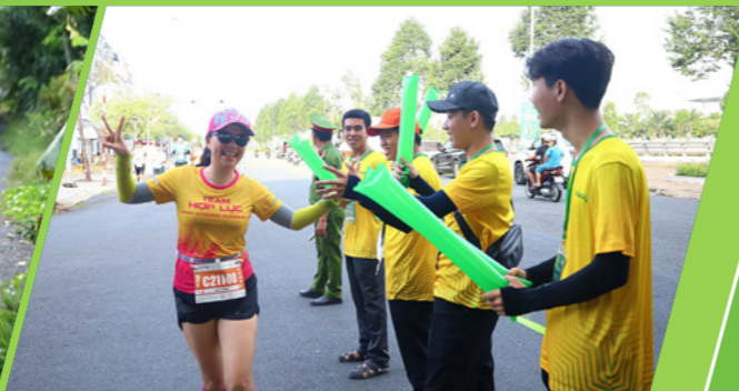
Tình nguyện viên cổ vũ nhiệt tình cho các vận động viên Volunteers enthusiastically cheered on the athletes