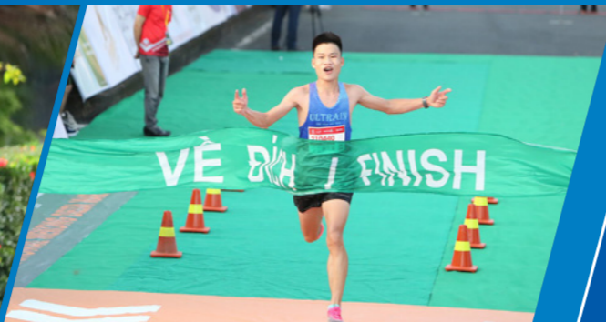
Những hình ảnh ấn tượng tại mùa giải lần thứ 5 Impressive Images from the 5th Edition of the Race