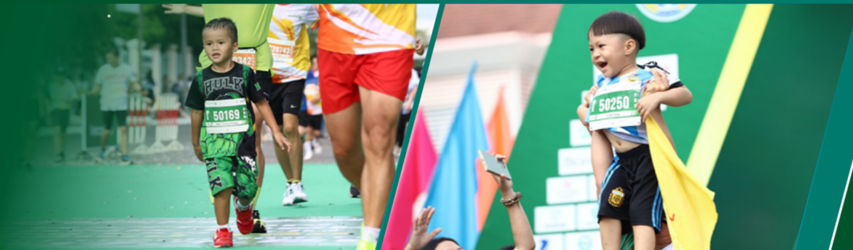
VĐV nhí tự tin tham gia cự ly 5km cùng người thân A young runner confidently joined the 5km race alongside his family members

IMPRESSIVE IMAGES OF THE MEKONG DELTA MARATHON IN HAU GIANG PROVINCE OVER THE YEARS