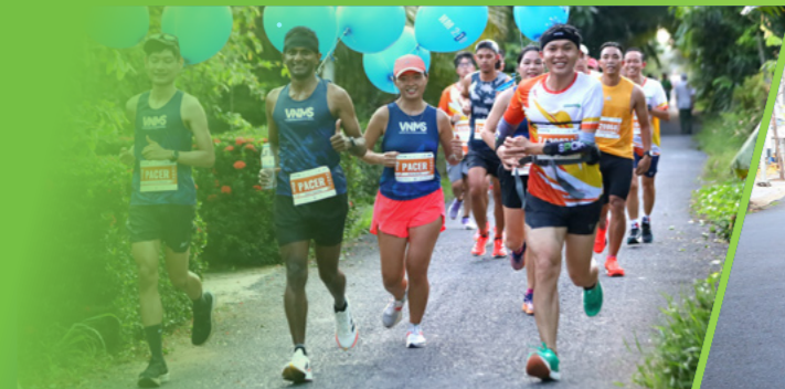
Vận động viên nước ngoài tham gia nhóm Pacer cự ly 21km International runners joined the pacer group for the 21km distance.

IMPRESSIVE IMAGES OF THE MEKONG DELTA MARATHON IN HAU GIANG PROVINCE OVER THE YEARS