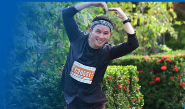
Nhiều runner với những tạo hình rất thú vị Many runners with very creative and interesting costumes

IMPRESSIVE IMAGES OF THE MEKONG DELTA MARATHON IN HAU GIANG PROVINCE OVER THE YEARS