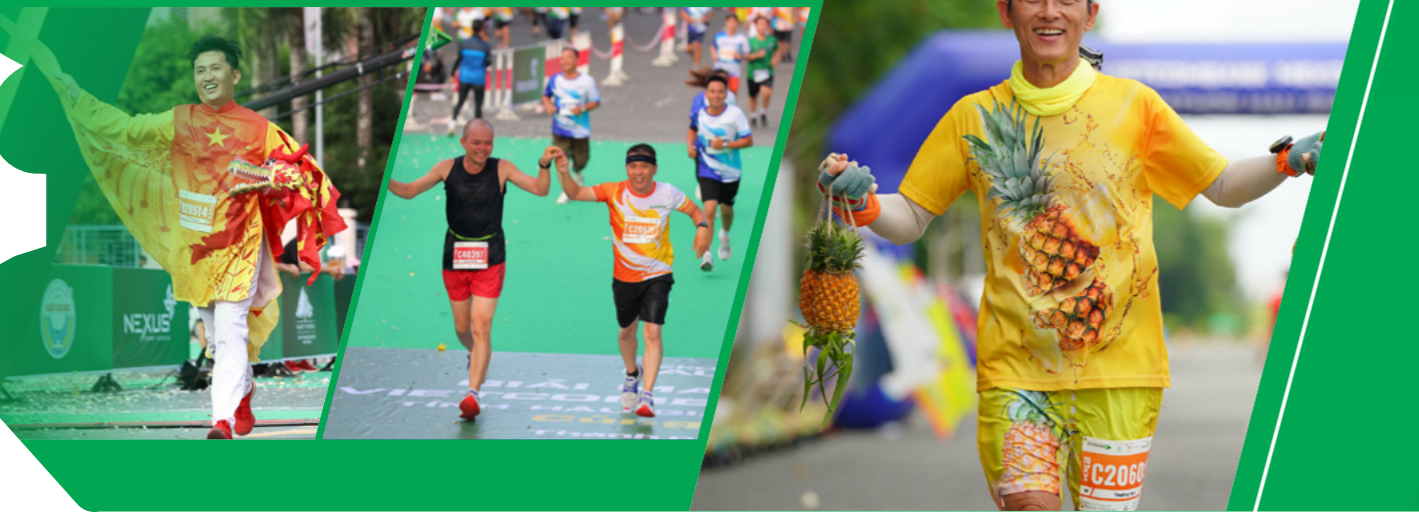
Những hình ảnh ấn tượng tại mùa giải lần thứ 5 Impressive Moments from the 5th Edition of the Race

The Vietcombank Mekong Delta International Marathon Hau Giang 2024, the fifth edition, attracts over 10,000 runners, setting new, more professional standards, and solidifying its position as the largest marathon in the Mekong Delta region. The race features distances of 5km, 10km, 21km, and 42km, with courses directly measured and certified by experts from the International Marathon Association (AIMS) to meet international standards. A total of 10,932 runners participated, including 19 international athletes from Japan, India,