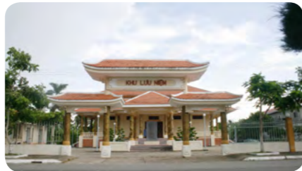
Khu trù mật Vị Thanh Hoà Lự