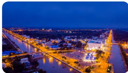
Trung tâm Hậu Giang