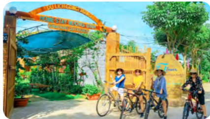
Homestay Mương Đình