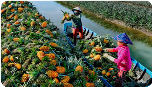
Khóm Cầu Đức