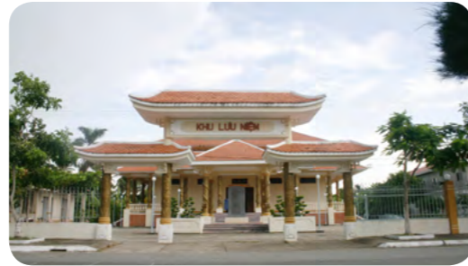
Khu trù mật Vị Thanh Hoả Lựu