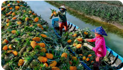
Khóm Cầu Đức

HẬU GIANG – KHÓM CẦU ĐỨC – MƯƠNG ĐÌNH Khóm Cầu Đức – Kênh xáng Xà No – Western Pearl – Khu trù mật Vị Thanh Hoà Lự – Homestay Mương Đình