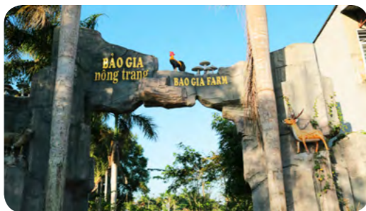
Bảo Gia Farm

HẬU GIANG – BẢO GIA FARM – SỰ KẾT HỢP GIỮA NÔNG NGHIỆP VÀ DU LỊCH Bảo Gia Farm – Homestay Mương Đình – Trung tâm Hậu Giang