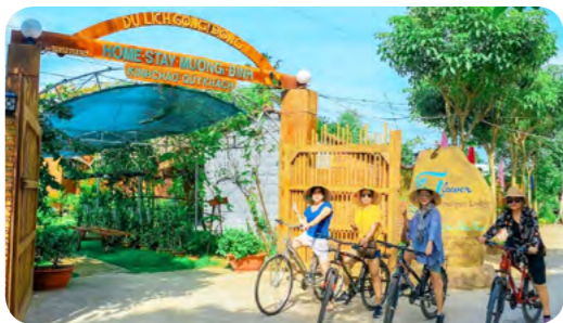
Homestay Mương Đình