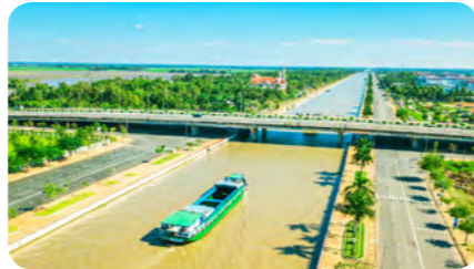
Kênh xáng Xà No